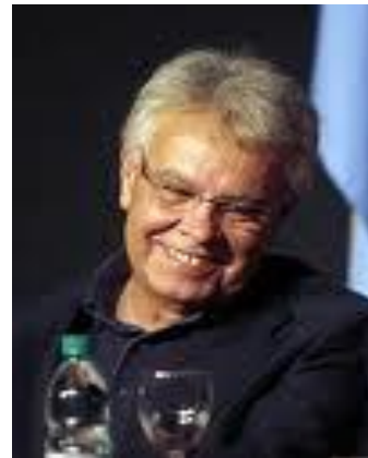
En la actualidad