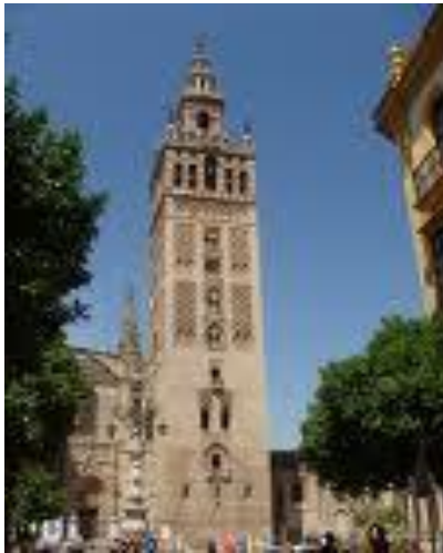
Giralda de Sevilla