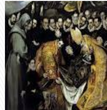
Detalle del Entierro