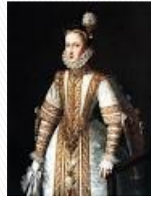
Ana de Austria