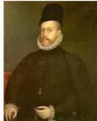
Felipe II el rey católico