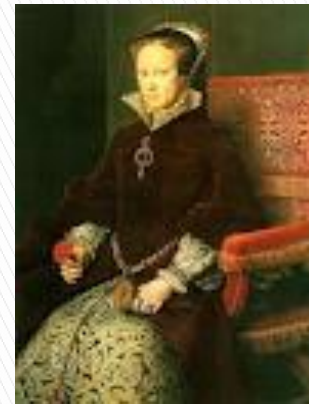
María I de Inglaterra