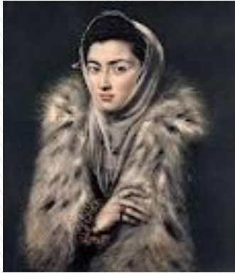
Retrato de mujer