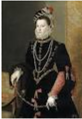
Isabel de Valois