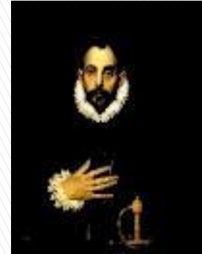
Caballero con la mano en el pecho