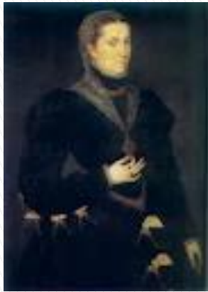
María Manuela de Portugal