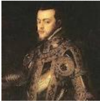
Felipe II de armadura