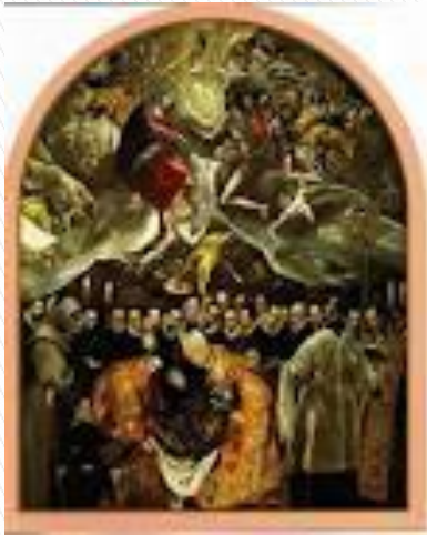
El entierro del conde de Orgaz