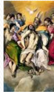
La Santa Trinidad