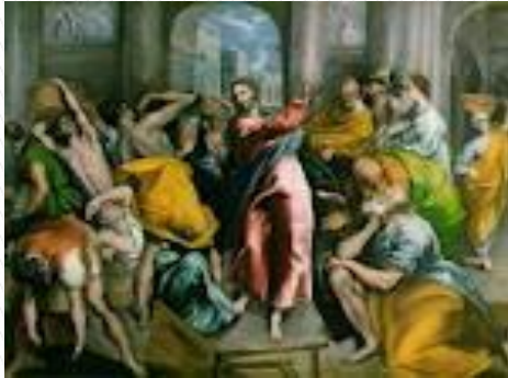
Cristo en el Templo