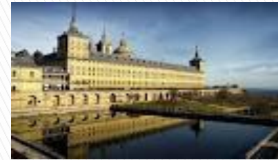
El palacio de El Escorial